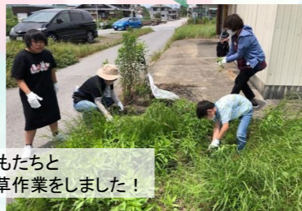
子どもたちと 除草作業をしました!