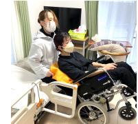
スライディングシート