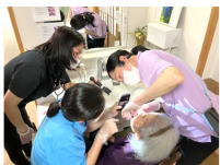
口から食べる喜びを支える